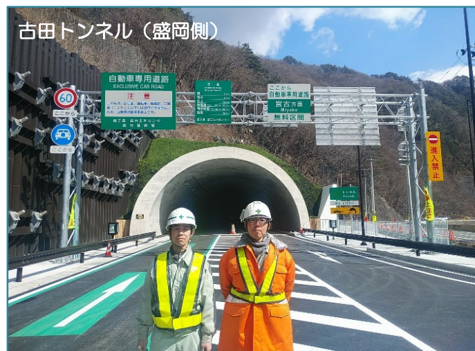
古田トンネル（盛岡側）